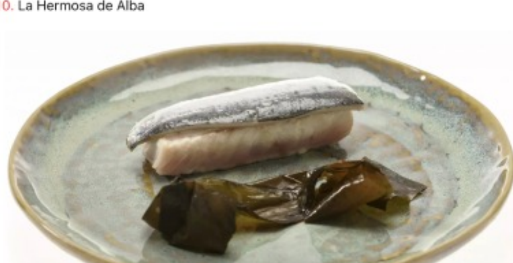
Uno de los platos de Ricard Camarena. / RICARD CAMARENA