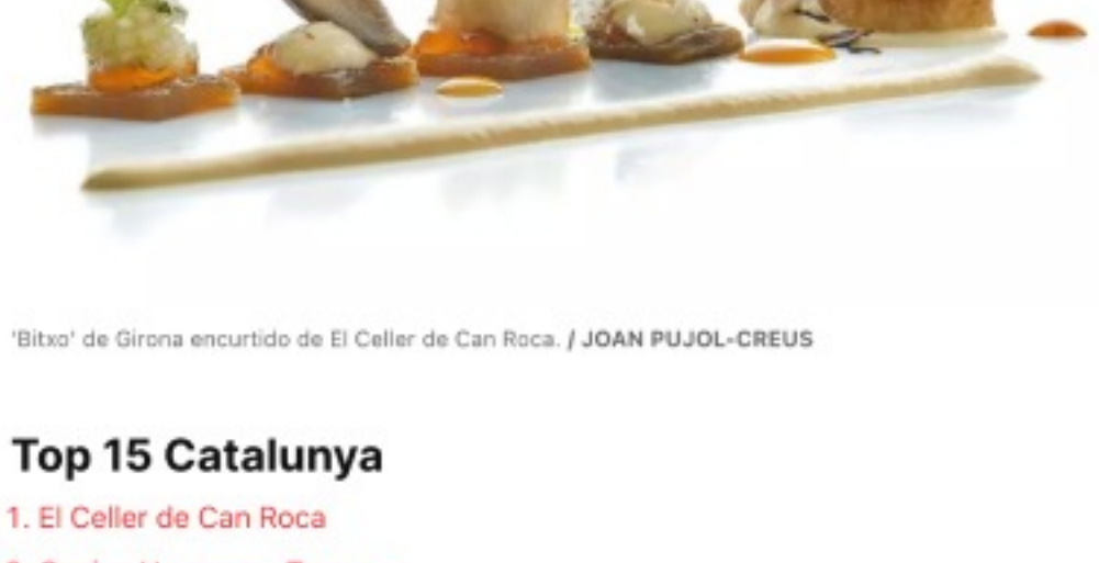
'litoral' de Girona encurtido de El Celler de Can Roca.