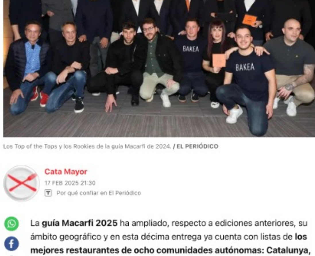
Los Top of the Tops y los Rookies de la guía Macarfi de 2024.