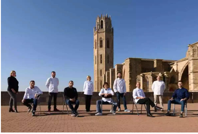
Imatge d'alguns dels xefs participants en la 9a edició de Porcpassió a Lleida.